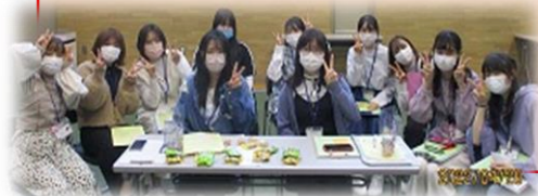
■新入生歓迎会：自治会役員が企画・運営し、自己紹介やゲームで学年を超えて交流しました