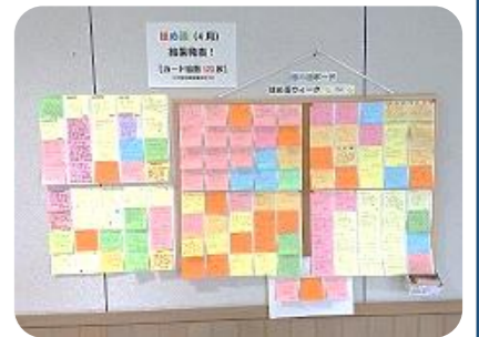
【図書室前のボード】貼りきれないほどのカードが集まりました!

メンタルヘルススーパーバイザー(臨床心理士)からのご提案で、学生や教職員がお互いの良いところを認めたりほめる取組を通じ、相互のコミュニケーションの活性化を図ります。実名でカードを書き、ボードに貼って共有しますが、説明直後から、競い合うようにカードが貼られ、学生の積極性と観察力の鋭さに敬服しています。4月は総計123枚のカードが貼られました。年9回の予定で取組を進めてまいります。