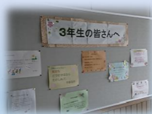
■実習に行く3年生へ、教員から一言メッセージを掲示しました