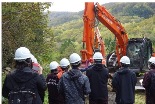
林業施業現場見学

また、北森カレッジの卒業生に後志地域の魅力をPRし、地域の林業事業体等への就業につなげる取組をしています。