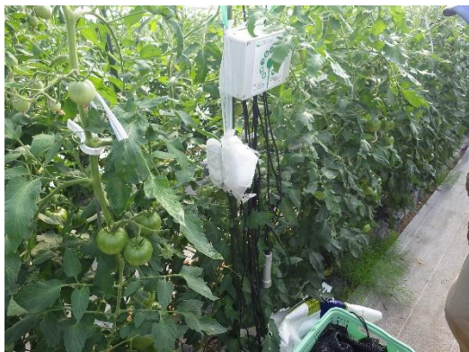
園芸用ハウスに設置した環境モニタリング装置

農業者の高齢化や労働力不足が深刻化する中、新規就農者や若手農業者の活動を支援し、次世代農業者を育成するとともに、GPSガイダンスシステムや自動操舵の活用、ドローンのリモートセンシングの実証などの取組を通じて後志管内の経営体系に応じたスマート農業のあり方を検討し、省力化技術の普及を図ります。