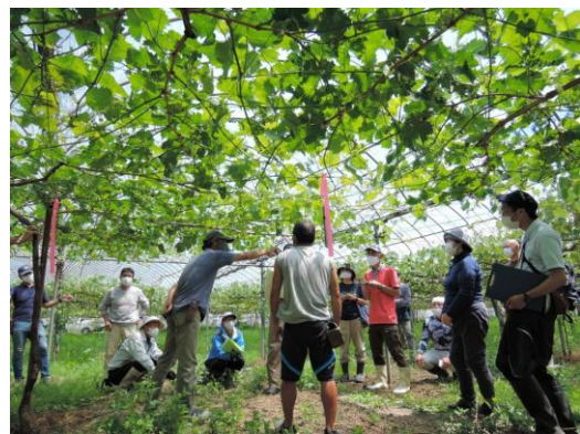
シャインマスカットの現地研修会