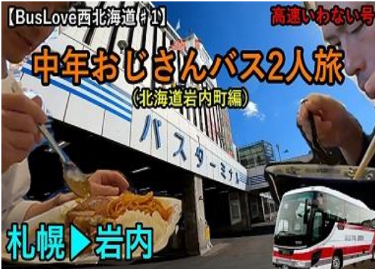
「中年おじさん岩内編」のサムネイル画像

そこで、バス利用促進のPR動画を職員自らが撮影・編集し、動画サイトに投稿することで、住民や観光客に対して、路線バスは便利で快適、安全で安価であることをPRし、路線バスの利用促進を図っています。