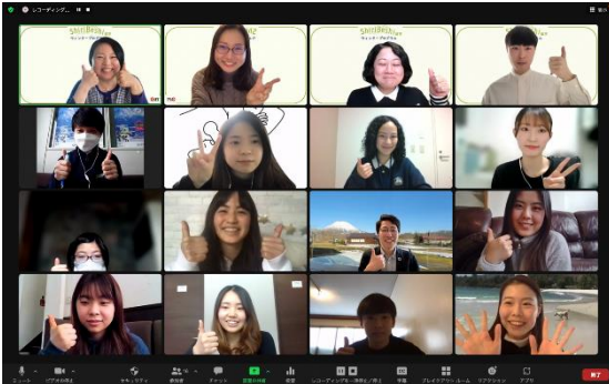
オンラインで実施した地域と交流する研修の参加者