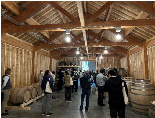
後志産カラマツをふんだんに使用したニセコ蒸溜所で行った地域材利用施設の見学会の様子