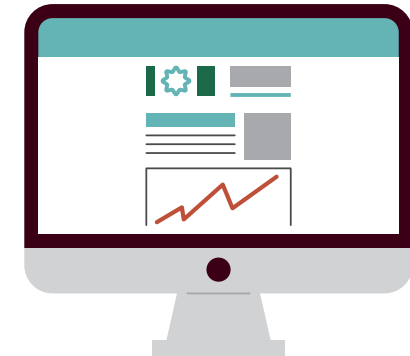
北海道ホームページ