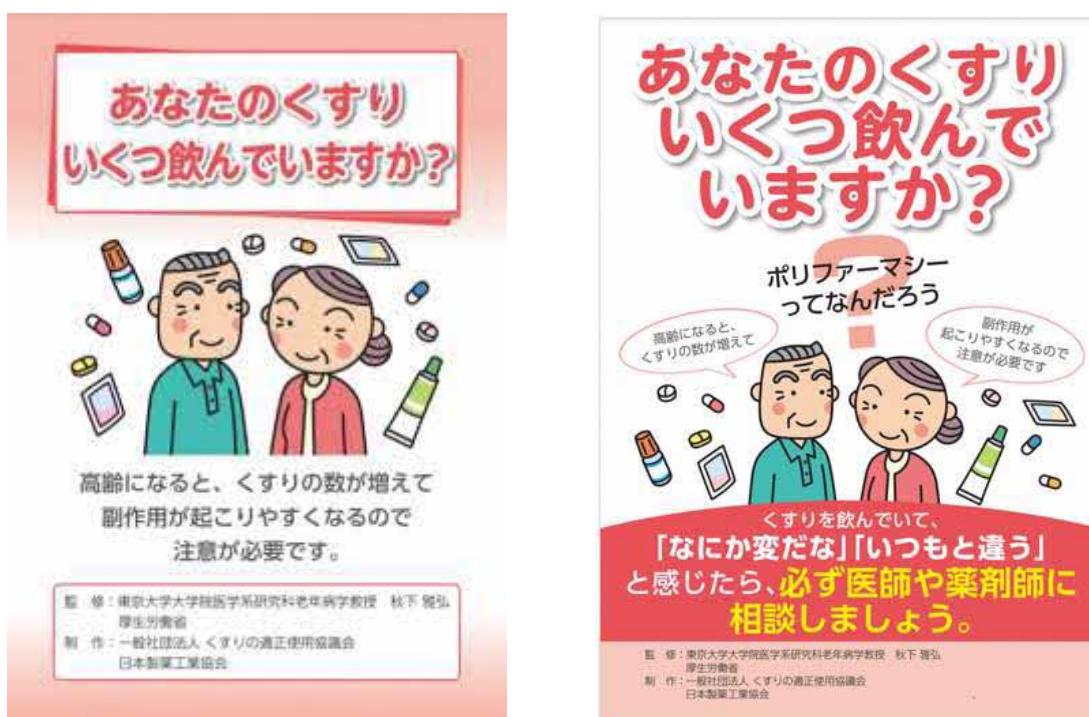
図1 一般社団法人くすりの適正使用協議会ウェブサイト「あなたのくすりいくつ飲んでいきますか」のパンフレット(図左)、ポスター(図右)のイメージ

https://www.rad-ar.or.jp/knowledge/post?slug=polypharmacy