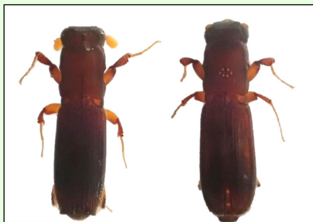
体長：約 5 mm