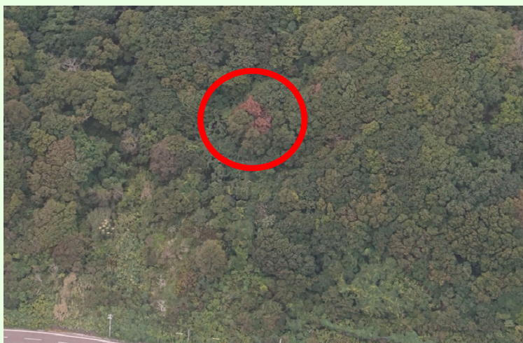
▲北海道のナラ枯れ被害の様子

カシノナガキクイムシ（以下「カシナガ」という）が持ち運ぶ病原菌（以下「ナラ菌」という）により、ミズナラやカシワなどのナラ類が枯死する伝染病です。