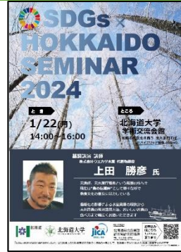
チラシ（昨年のもの）