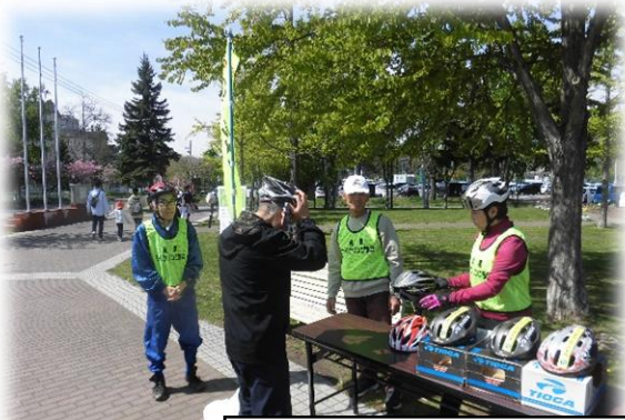
乗車用ヘルメットの展示、試着の様子

5月13日、農試公園で開催された札幌サイクリング協会、農試公園指定管理者札幌市公園緑化協会主催の「自転車カンタン！点検修理体験」のイベントにおいて、公園利用者に対するチラシ等の啓発品の配布や、乗車用ヘルメットの展示、試着などヘルメット着用促進及び自転車安全利用の啓発活動を実施しました。