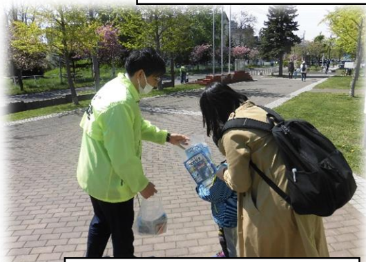
啓発品配布の様子