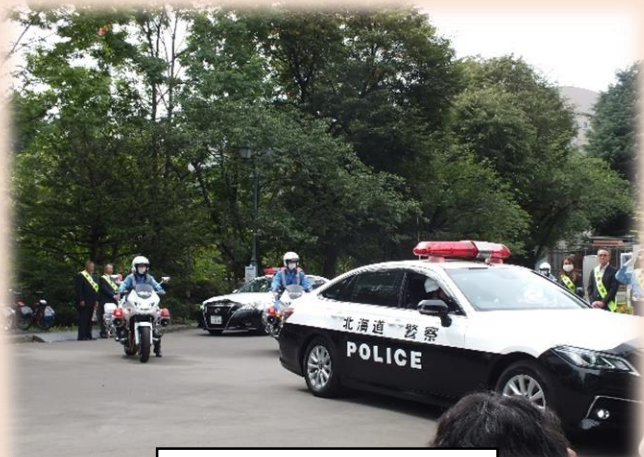
警察車両の出動式