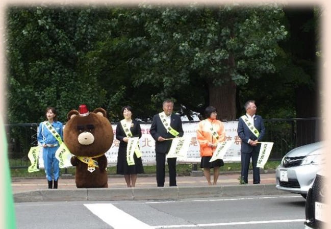
旗の波運動による街頭啓発