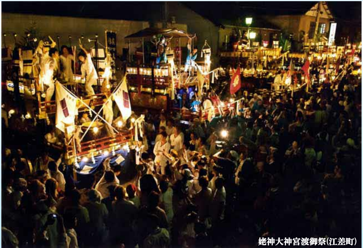
姥神大神宮渡御祭(江差町)