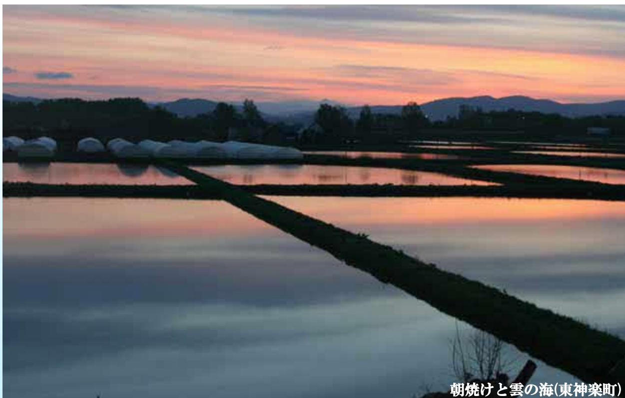
朝焼けと雲の海(東神楽町)