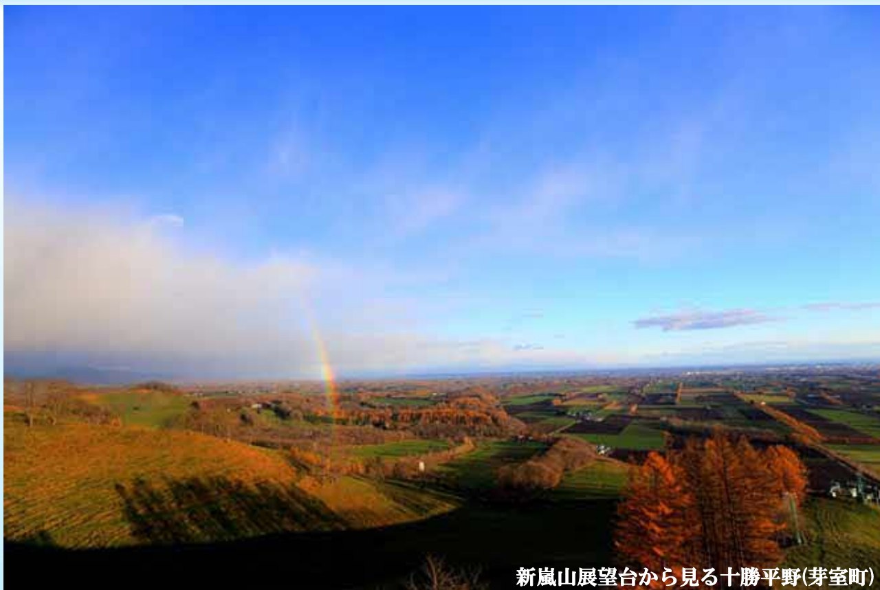
新嵐山展望台から見る十勝平野(芽室町)