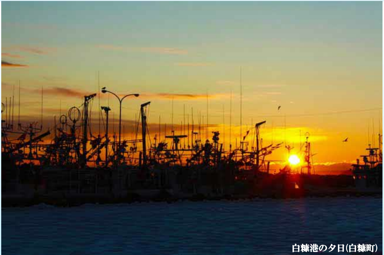
白糠港の夕日(白糠町)