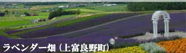
ラベンダー畑(上富良野町)

それは、地域の歴史を物語り、文化の積み重ねを通じて人々の暮らしを反映し、環境と地域社会との度合いを客観的に把握できるものです。