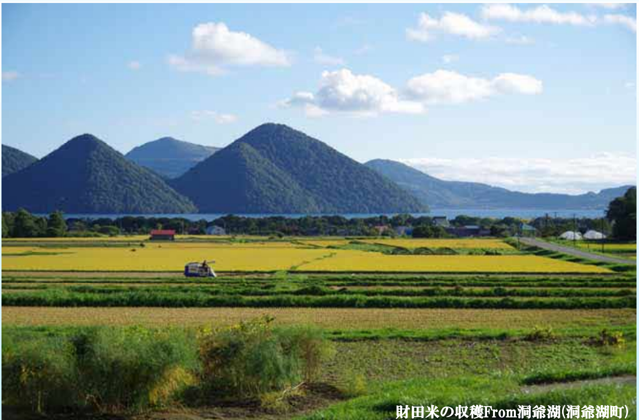
財田米の収穫From洞爺湖(洞爺湖町)