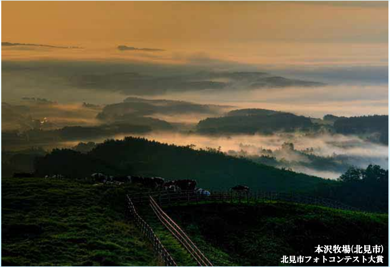
本沢牧場(北見市) 北見市フォトコンテスト大賞