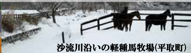
沙流川沿いの軽種馬牧場(平取町)