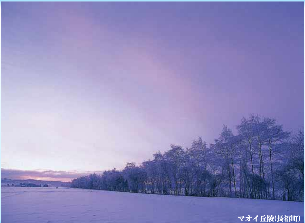
マオイ丘陵(長沼町)