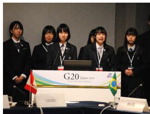
高校生による提言