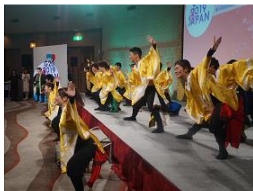
アトラクション（YOSAKOIソーラン）