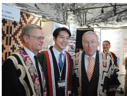
各国代表の皆様がアイヌ民族衣装を試着