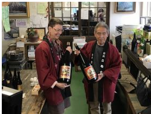
二世古酒造の見学(倶知安町)