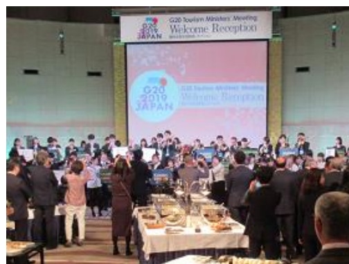
くっちゃんプラスオーケストラの演奏により終演