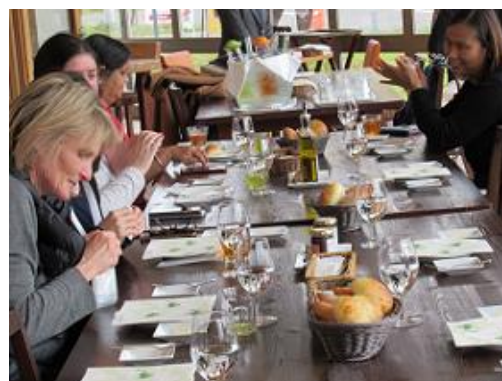
ヴィラルシピアでの昼食(倶知安町)