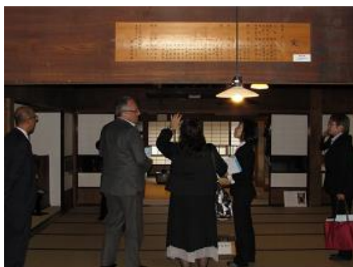
鯉御殿とまり見学(泊村)