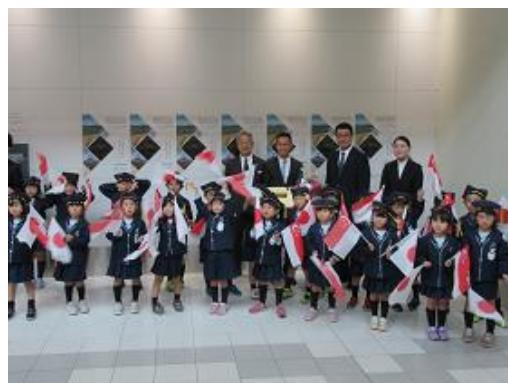
千歳市北陽幼稚園園児によるシンガポール政府観光局のキース・タン長官への花束贈呈