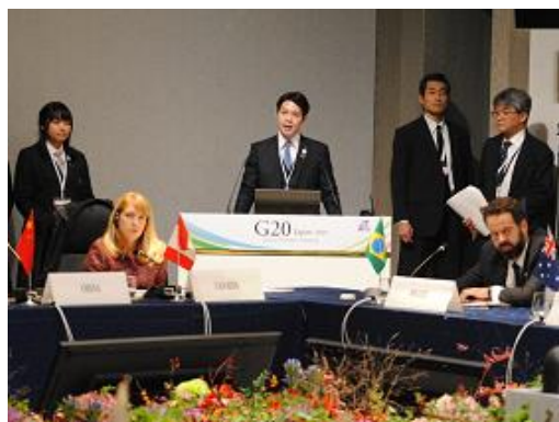
北海道知事プレゼンテーション