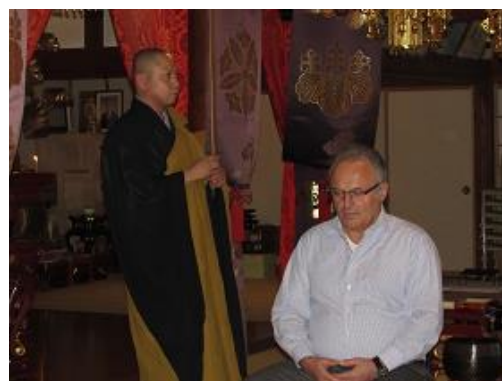
神恵内天龍寺での座禅体験(神恵内村)