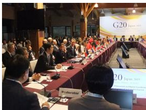
大臣会合② 官民セッション