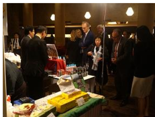
レセプション会場に向かう途中に立ち寄り