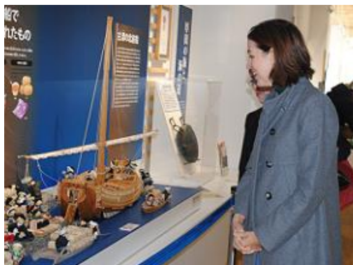
「石狩」あいろーど厚田で北前船展示を見学(石狩市)