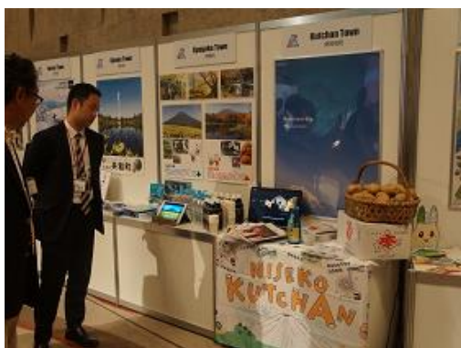
北海道 PR ブース（「後志管内20市町村 PR」ブース）