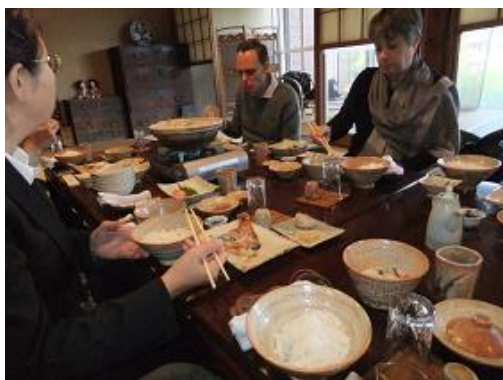
石狩鍋発祥の店「金大亭」での昼食(石狩市)

道の駅見学(「石狩」あいろーど厚田)[石狩市]、昼食(あまえびと寿司: 寿司まつくら)[増毛町]、ふるさと歴史通り散策(増毛駅、国稀酒造など)[増毛町]