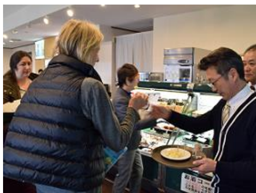
手作り加工センタートワベールでの試食(黒松内町)

酒造見学・試飲(二世古酒造)[倶知安町]、高校生と交流(ニセコ高校)[ニセコ町]、牧場・ミルク工 房見学(高橋牧場)