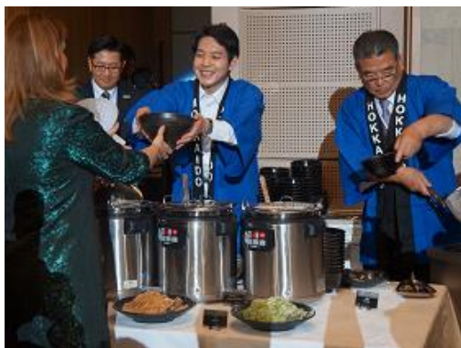
知事、議長による食のPR（ラーメン屋台）