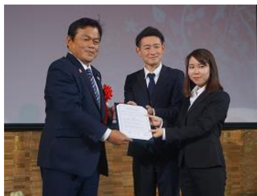
大学生による学生サミット宣言