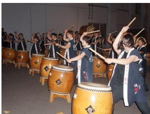
羊蹄太鼓の演奏によるお出迎え(ホテル正面玄関前)