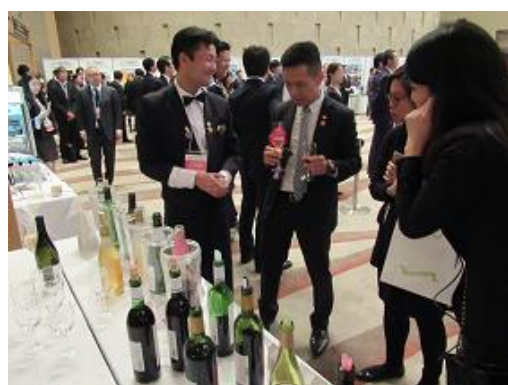
道産酒(ワイン、日本酒など)の提供