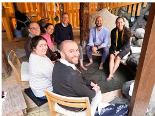
心の里定山での足湯体験(札幌市)