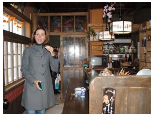
ふるさと歴史通り散策(増毛町)