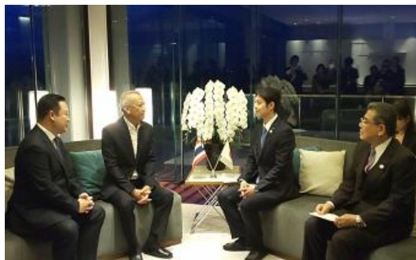
知事・議長がタイ国観光スポーツ省のピパット・ラッチャキップラガン大臣を表敬