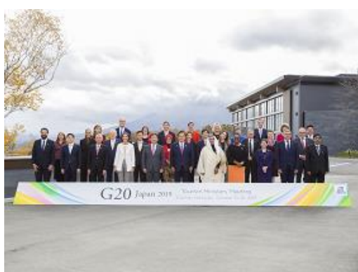
フォトセッション