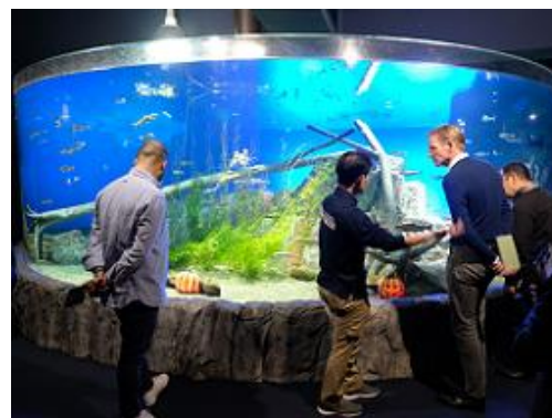
サケのふるさと千歳水族館の見学(千歳市)