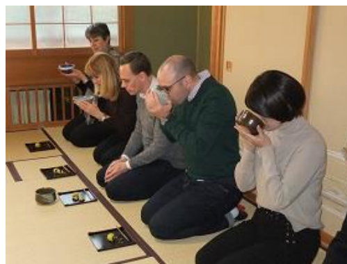
和菓子作りと茶道の体験(長沼町)