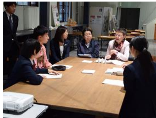
ニセコ高校生徒との交流(ニセコ町)