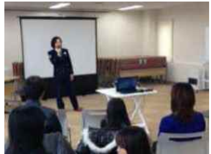
児童生徒対象の防犯講座