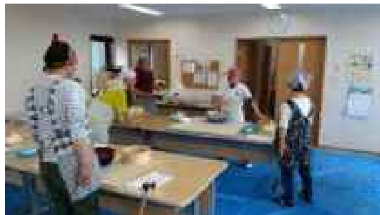
そば打ち講座(月1回)