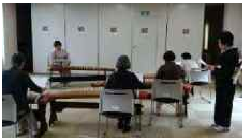
箏曲に親しむワークショップ（月2回）