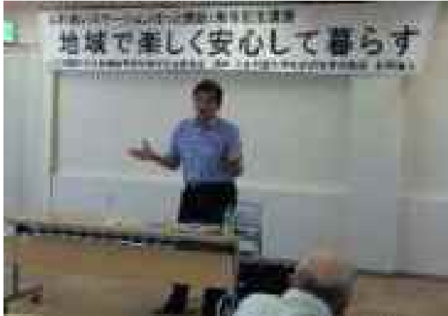
北星学園大学出前講座