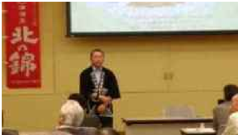
入門日本酒学(年1回定期開催)