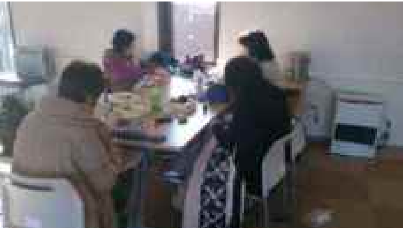
お茶やお菓子を持ち込みながら趣味の手芸