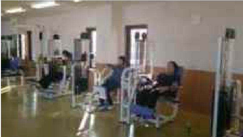
仲間とトレーニング