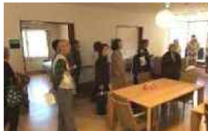
飛び出すほっと 介護施設見学会