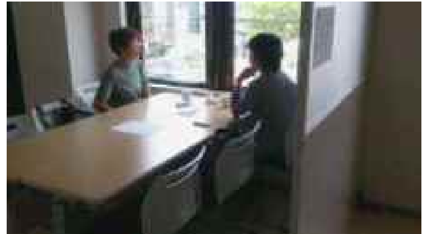
チョットひと息ティータイム