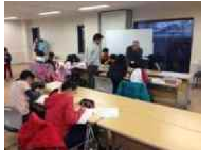
退職教員が中心になって開講する寺子屋