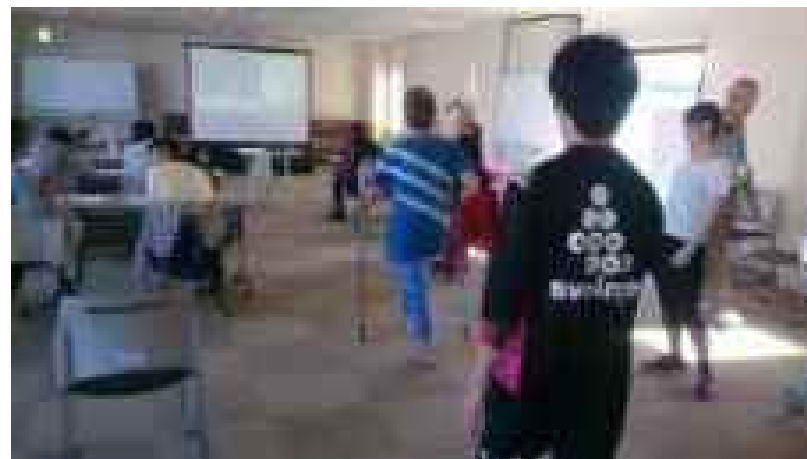
PT・OTによる身体イキイキ西島講座(隔月)