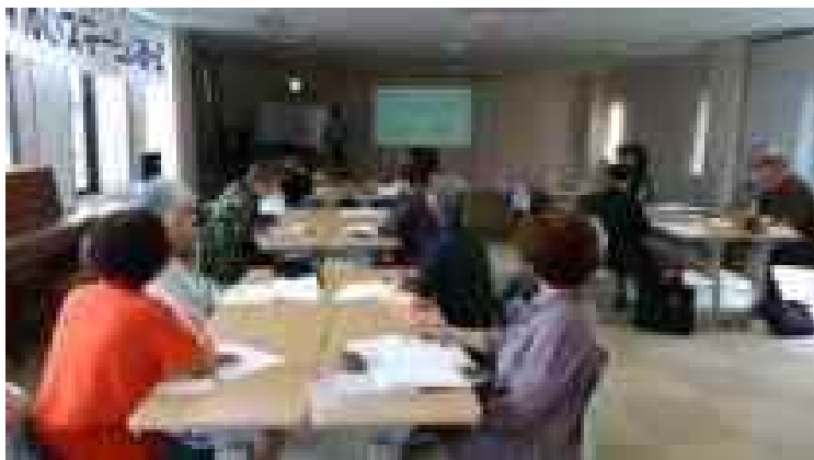
薬剤師による認知症と薬講座