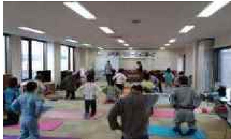
ストレッチング講座(月2回)