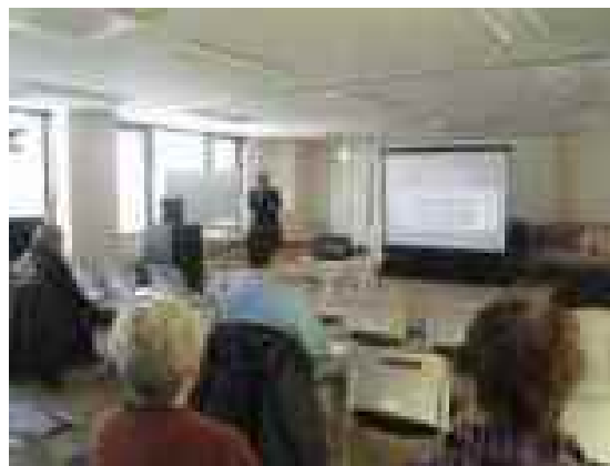
高齢者防犯教室(厚別警察)