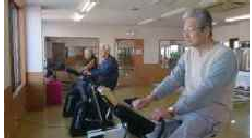
親子でトレーニング(中央の男性92歳要支1)