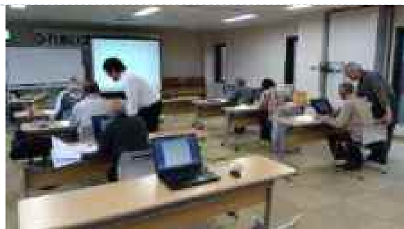
高齢者パソコン講座(年2回)