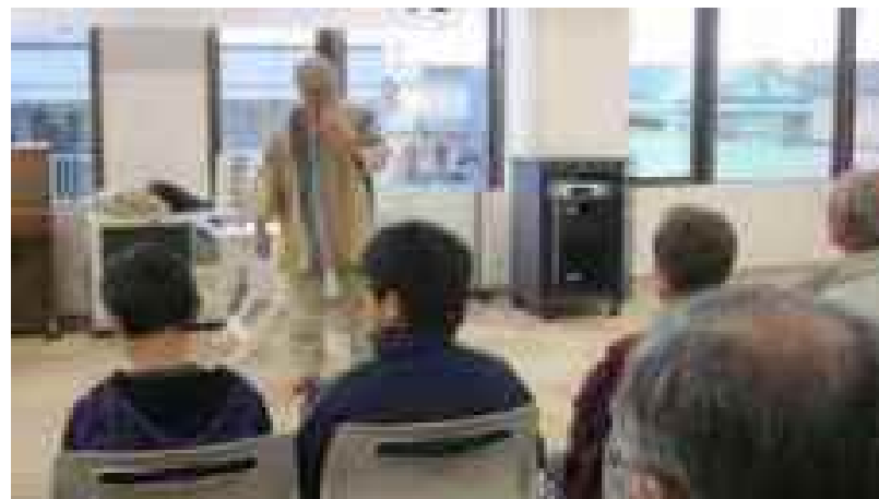
市内在住の方によるコンサート、演芸会