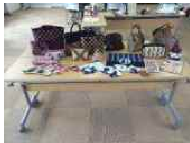
小物制作教室作品（月1回）