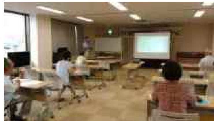
エンディングノートと遺言