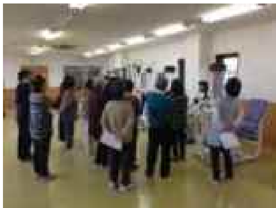
▶ トレーニングマシン講習会