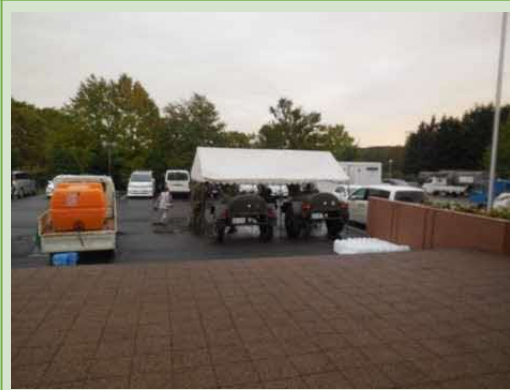
自衛隊による給水(9/10)