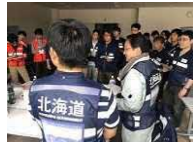
ミーティング(9月7日)