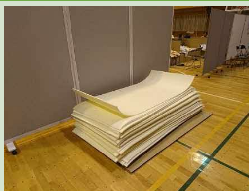
居住スペース用マット