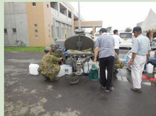
自衛隊による給水(9/8)