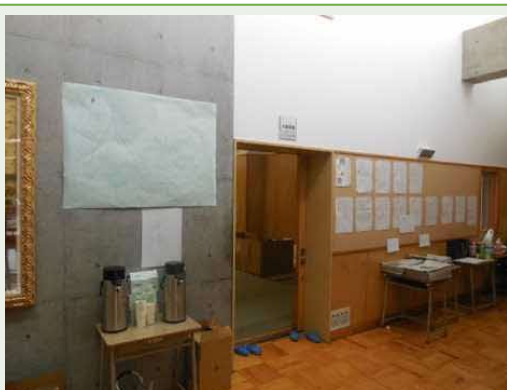
居住スペース・中央扉の奥(9/9)