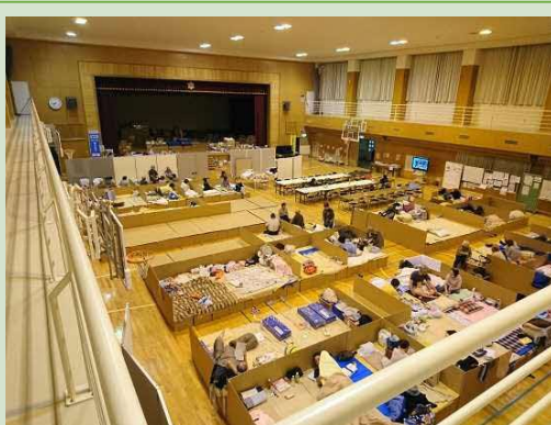
避難所居住スペース(9/12)