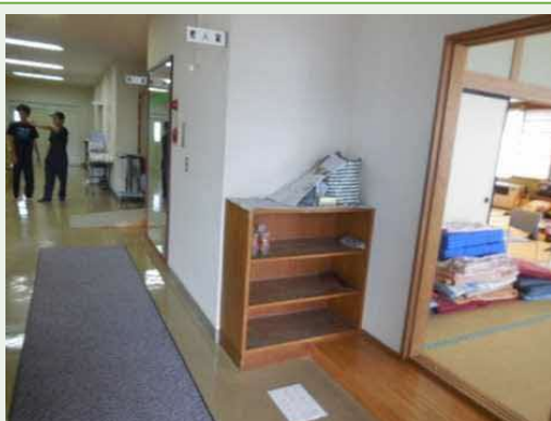
居住スペース・和室(9/9)