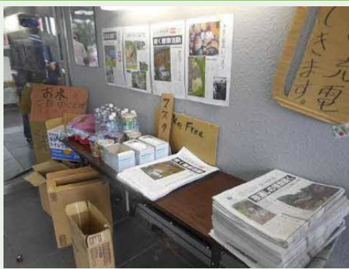
避難所入り口の物資置き場(9/8)