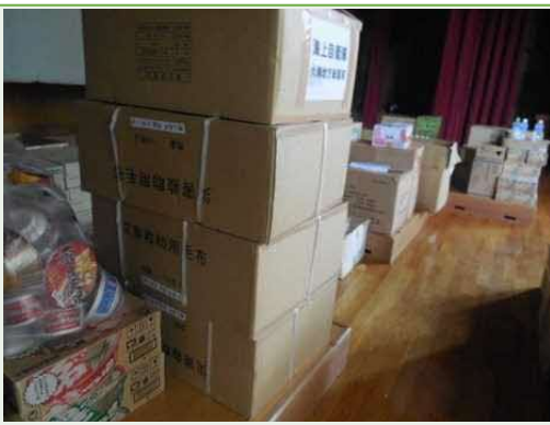
資材一時保管場所(9/10)