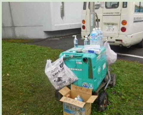
仮設トイレ前の手洗い場(9/8)