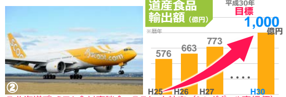
①北海道プレミアム食材商談会 ②スクート航空 (シンガポール直行便) ③ドバイでのプロモーションの様子