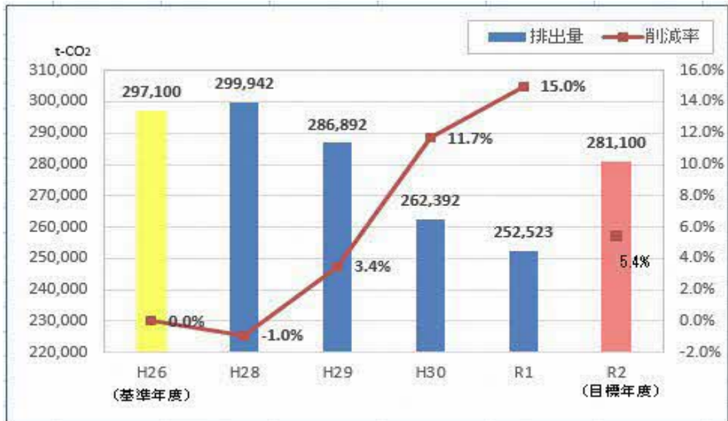
図1 第4期実行計画期間中(H28～R2)の温室効果ガス排出量の推移