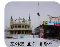
도야코 호수 유람선

마지막 일정은 도야코 호수 유람선. 온천가의 선착장에서 출발해 호수 안을 한바퀴 도는 코스는 1시간 정도 소요됩니다. 호수 가운데는 나카지마라는 작은 섬이 있는데 이 섬에는 특이한 동식물이 많이 서식하고 있습니다. 지금은 겨울이라 안에 들어갈 수 없었지만 여름에는 유람선에서 내려 산책도 가능하다고 합니다. 나카지마를 산책하기 위해서라도 날이 따뜻해지면 도야코를 다시 찾아야겠습니다.