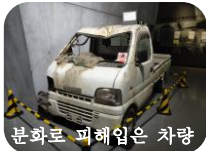
분화로 피해입은 차량