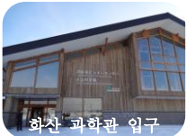
화산 과학관 입구

입장권을 끊고 안으로 들어가자 화산재를 뒤집어 쓴 소형 트럭이 제일 먼저 눈에 띄었습니다. 앞창문이 다 깨지고 차체가 찌그러진 이 트럭은 2000년 분화 당시에 피해 입은 것을 그대로 가져다 전시하고 있는 것이었습니다. 그리고 그 옆에는 지각변동으로 휘어진 선로와 무너진 도로 조각도 전시되어 있었습니다. 이것들을 보니 화산 분화로 인한 피해가 얼마나 크고 무서운지 느껴져 마음이 숙연해졌습니다.