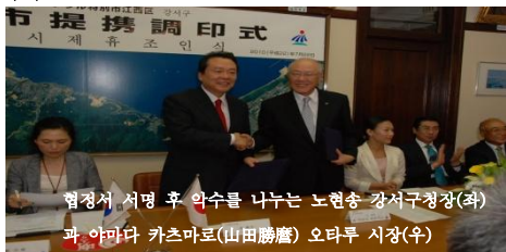
협정서 서명 후 악수를 나누는 노현송 강서구청장(좌)과 야마다 카츠마로(山田勝彦) 오타루 시장(우)

자매도시 제휴 조인식에서 야마다(山田)시장은 "양 도시의 교류가 다양한 분야로 확대되길 바란다."는 코멘트를, 노현송 강서구청장은 "양 도시와 한일 양국의 미래를 위해서 앞으로 청소년 교류에 힘을 쏟을 예정이다."라고 코멘트를 남겼습니다.