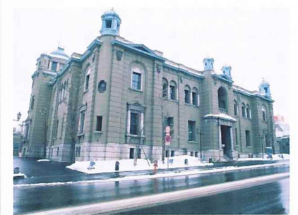
일본은행 구 오타루지점 (금융자료관)

곤니치와(안녕하세요!) 이번 달은 여러분께 동화의 나라 오타루시를 소개해드립니다. 한국 여러분께는 영화 '러브레터'나 드라마 '소금인형'(2007) '달콤한 인생'(2008), 다수의 뮤직비디오, CF 등의 배경으로 알려진 오타루. 오타루는 일본인에게도 이국정서가 넘치는 역사와 로맨스의 도시입니다. 과거 청어잡이로 부흥해 홋카이도의 중심지가 되어 금융기관이 도시에 집중되고 '북녘의 웰스트리트'라고 불릴 정도로 영화를 누렸던 도시. 지금도 시내에는 유럽형 석조 건물이나 오래된 일본 건축물 등이 남아 있습니다. 또한 주요산업이 관광업인 만큼 공예품(도예, 유리가공, 오르골) 등의 예쁜 가게가 펼쳐지는 메르헨(동화) 교차로 일대는 물론이고, 오타루의 얼굴이라 할 수 있는 운하에는 낮에는 오래된 석조 창고들을 배경으로 한 풍경이, 밤에는 등불이 점등되어 로맨틱한 분위기가 연출되어 봄·여름·가을·겨울 사계절 모두 따뜻하고 온화한 표정으로 수많은 국내외 관광객을 맞이하고 있습니다.