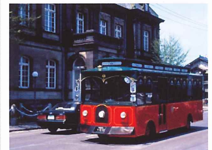
오타루의 관광투어를 달리는 버스

오겐키테스카? (お元氣ですか, 잘 지내십니까?) 와타시와 겐키테스. (私お元氣です, 저는 잘 지냅니다.)