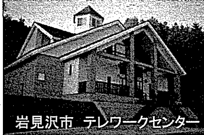
岩見沢市 テレワークセンター