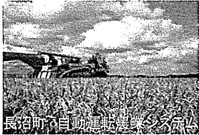
長沼町の自動運転農業システム

すべての地域でワークスペースを使ってテレワークを実施いただけます。 また、ご要望に応じて、視察メニューと休暇メニューをご提案させていただきます。