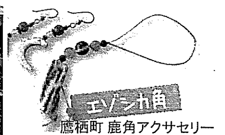
鷹栖町 鹿角アクセサリー