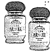
「鹽梅」「酸塩」 小坂農園(むかわ町)