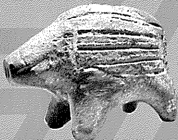
4. 道指定有形文化財 動物形土製品 (函館市日ノ浜遺跡出土)