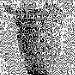
6. 土器 (北斗市館野2遺跡出土)