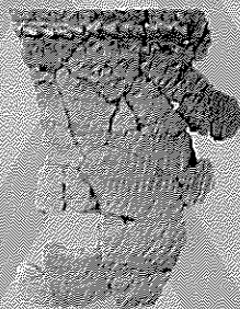
5. 土器 (帯広市大正3遺跡出土)