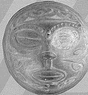
2. 重要文化財 土面 (秋田県能代市麻生遺跡出土)