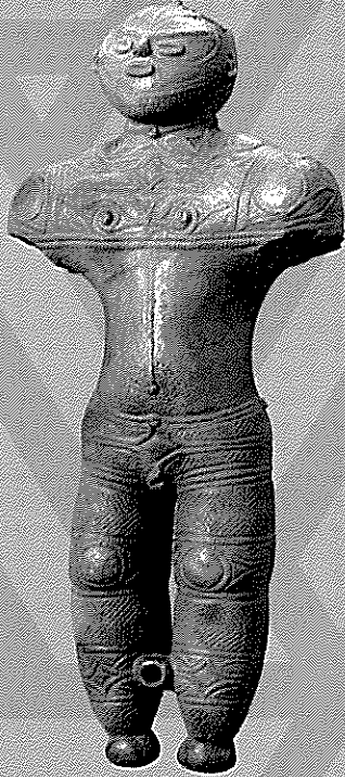
1. 国宝 中空土偶 (函館市曙保内野遺跡出土)

縄文の世界によろこそ! 人や動物の姿で表現された土製品や土偶が勢揃い! 縄文人の高度な技術や豊かな表現力に驚きです! じっくりとご覧ください。