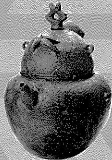
3. 道指定有形文化財 赤彩注口土器 (八雲町野田生1遺跡出土)