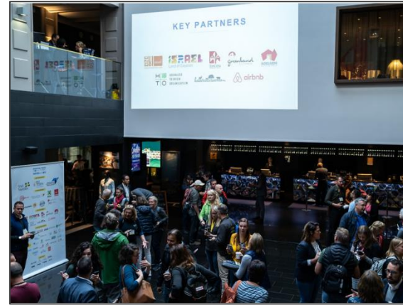
会場における企業バナー掲示例