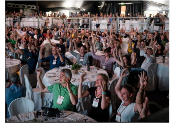
オープングレセプションの様子