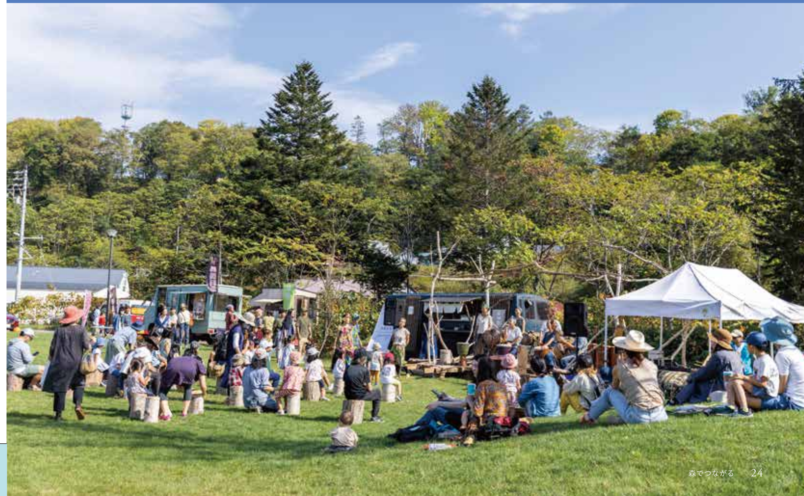
ニセコ町で開催された木育イベント「Niseko Wood Park」の様子

自治体と企業、住民が一体となり、まちづくりの一環として、森林空間を活用した木育活動に取り組むニセコ町をご紹介します。