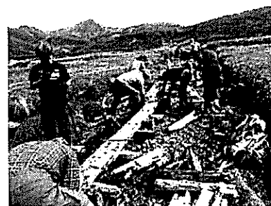
昨年度のイベント風景

いただいた寄附金は、木道の腐食のひどい箇所を重点として必要な資材の購入とイベント実施費用に活用します。