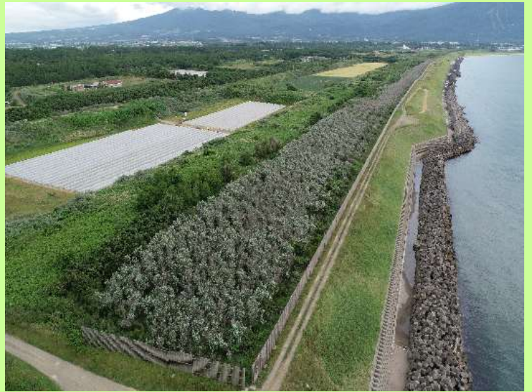
▲海岸防災林【共和町】