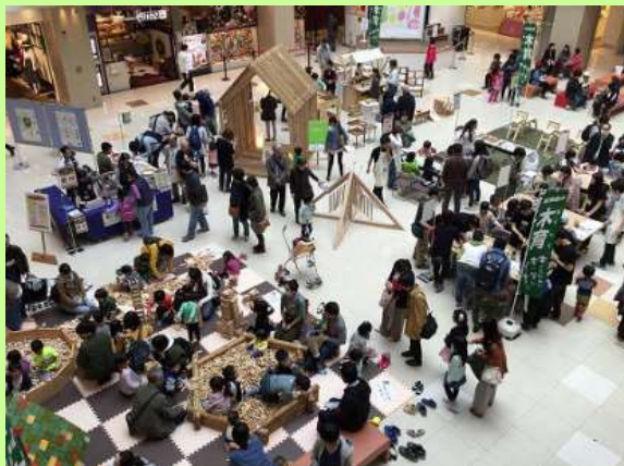
▼もくもくフェスティバル