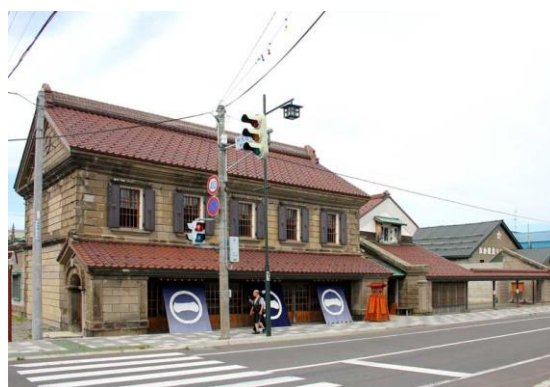
[旧商家丸一本間家]

○国稀酒造 ○旧商家丸一本間家 ○リバーサイドパーク ○元陣屋 ○果樹園 ○岩尾温泉あつたま〜る ○暑寒別岳（登山） ○暑寒別岳スキー場 ○雄冬海岸 ○増毛駅