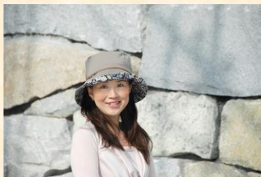
▲機能性とデザイン性が優れた帽子