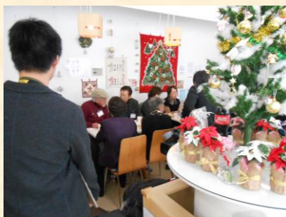
▲行事に参加中の様子

ボランティア活動を行う人とボランティア活動を行いたい人を結びつける 障がい者や市民団体がボランティアを集める際やボランティアに参加する際の情報源の供給のために 月刊ボラナビの発行及びボランティアイベント情報を掲載したホームページを運営している。 また、別に孤立しがちな独身者同士が寄稿やオフ会を通じて仲間作りを行う「お独り様会」を運営し孤立・ 孤独死・少子化などの社会的課題の解決や緩和を目指している。 平成10年に活動を始め、好評を得ており、長期にわたって活動を行っている実績と活動の独自性が評価 された。