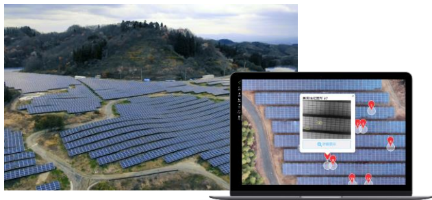
ソーラーパネル点検アプリケーション SOLAR Check