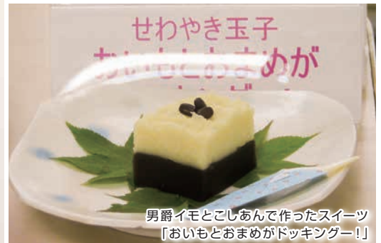
男爵イモとこしあんで作ったスイーツ 「おいもとおまめがドッキングー！」