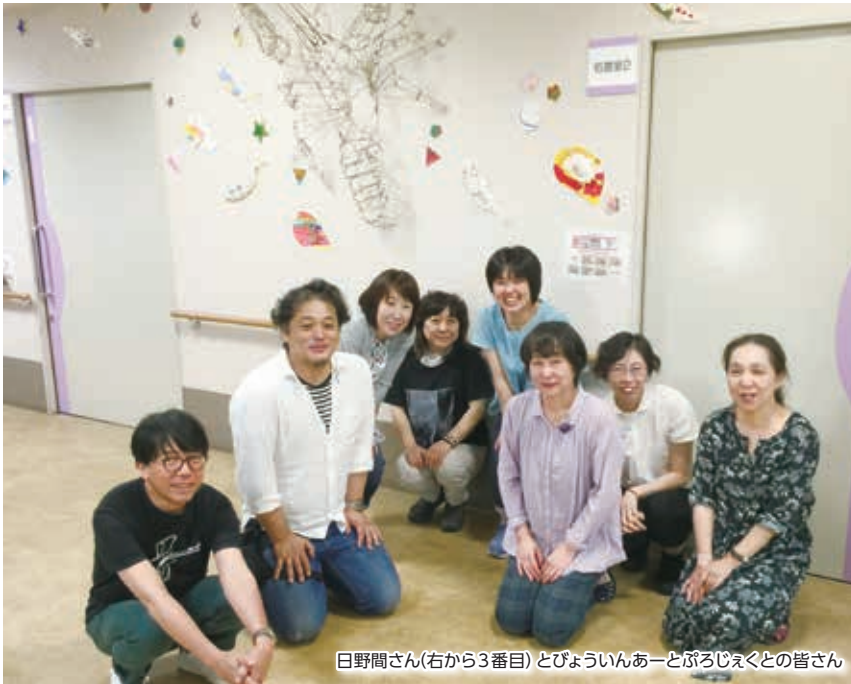
白野間さん(右から3番目)とびょういんあーとぷろじえくとの皆さん

1962年生まれ、旭川市出身。学生時代から画家を志していたが、短大卒業後は札幌市内の一般企業に就職。公募展に出品したり個展をする等、制作と活動は続け、1999年に退職しドイツ、オーストリアのギャラリーと契約。2006年から活動拠点を国内とし、2008年「びょういんあーとぷろじえくと」を設立。