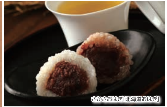
さかさおはぎ「北海道おはぎ」