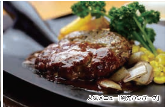
人気メニュー「剣先ハンバーグ」